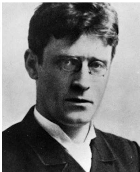
Hamsun op 30-jarige leeftijd