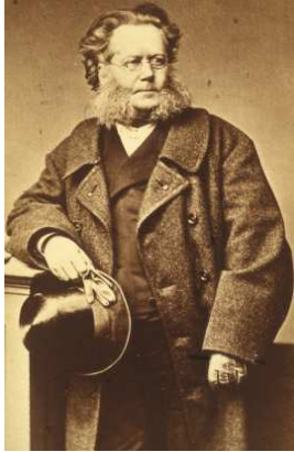
Foto van Ibsen uit 1879, enkele jaren voor hij Vildanden schreef