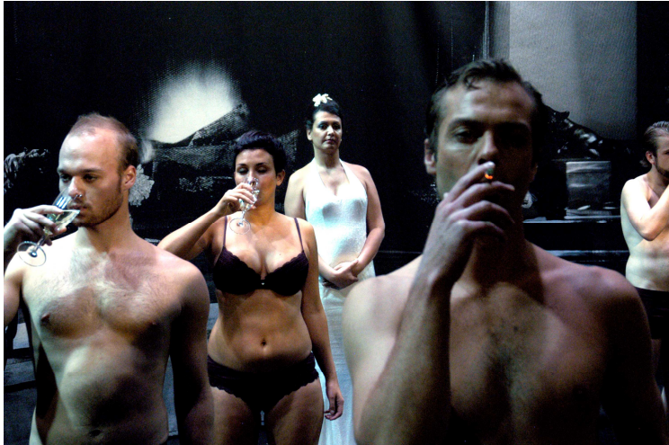
Opvoering tijdens het Ibsenfestival 2006 in een regie van Toril Goksøyr og Camilla Martens. Scène uit het eerste bedrijf: het feestje bij grosserer Werle.